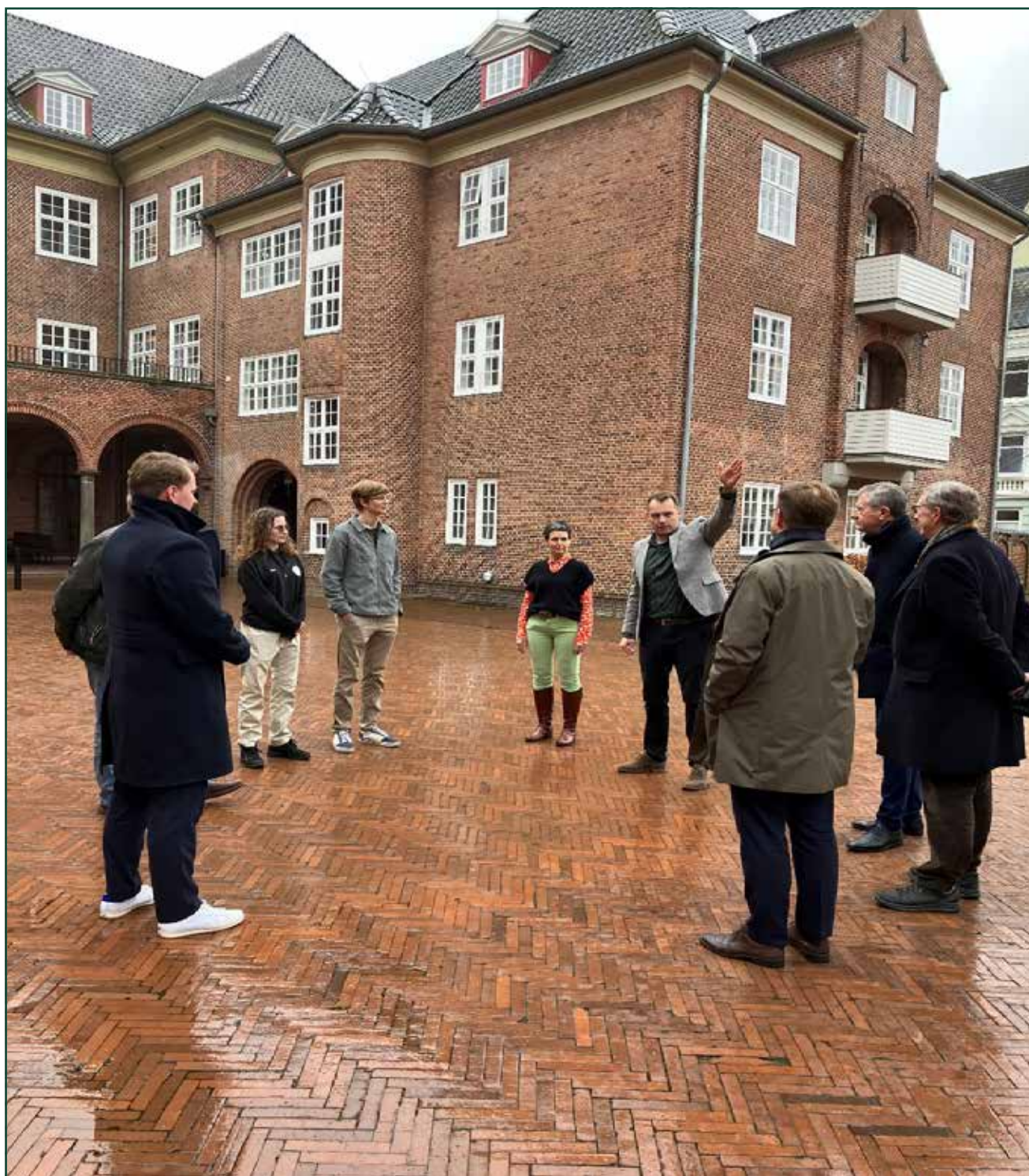
Sydslesvigudvalget på besøg på Duborgskolen

For at sikre et mere indgående kendskab til mindretallet blandt de øvrige medlemmer af Folketinget medvirkede udvalget derudover til at arrangere et velbesøgt gå-hjem møde på Christiansborg den 23. maj.