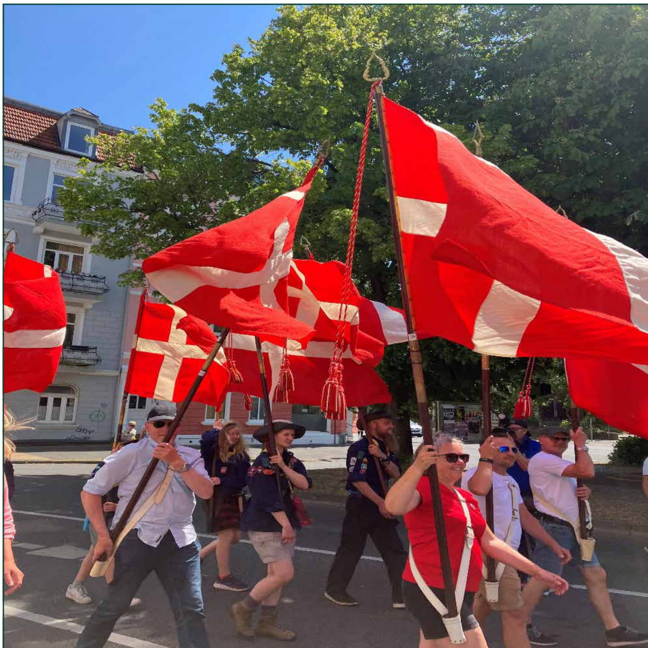
Årsmødeoptog i Flensborg

årsmøder. Udvalgets medlemmer har derudover deltaget i en lang række arrangementer hos de sydslesvigske foreninger, herunder generalforsamlinger, debatarangementer m.v.