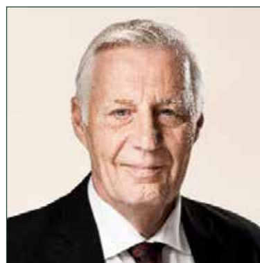
Henrik Dam Kristensen (S)