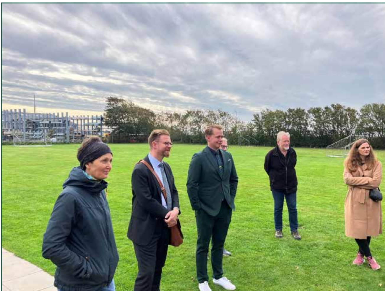
Sydslesvigudvalget besøger Sild Danske Børnehave under årets besigtigelsestur

I 2023 blev besigtigelsesturen afholdt i dagene 25. – 26. september. Udvalget besøgte en række institutioner og foreninger primært på vestkysten. Tabellen herunder viser udvalgets program: