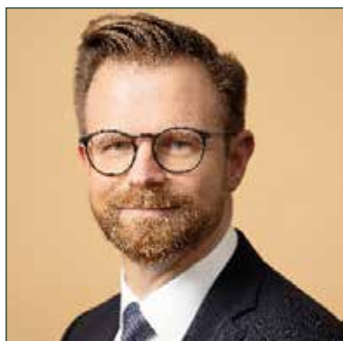
Benny Engelbrecht, MF (S) Formand